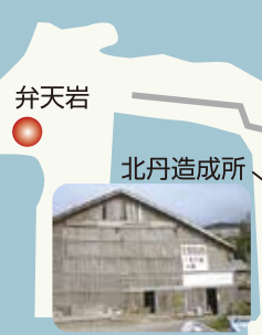
弁財天 北丹造成所