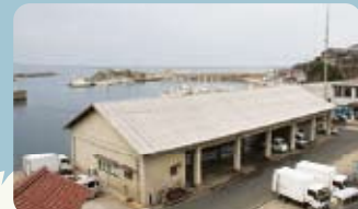
間人地方卸売市場 かきのシーズンは14:00頃から 魚は8:00頃から（セリ有り） 仲買人から魚を買うことも できます