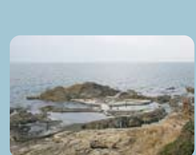
親水プール 海水のプール