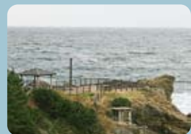
日本海を望む絶景の公園 間人港公園